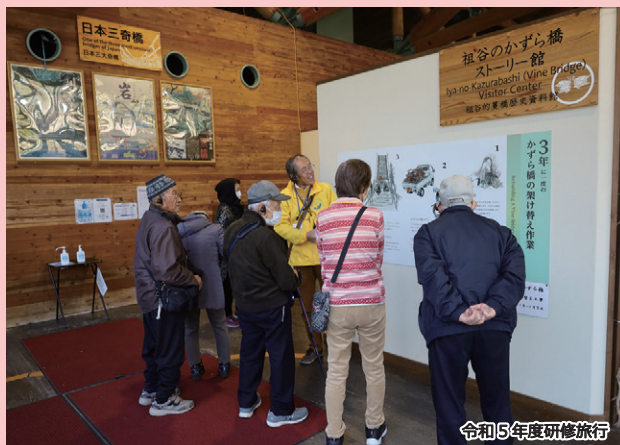
令和5年度研修旅行