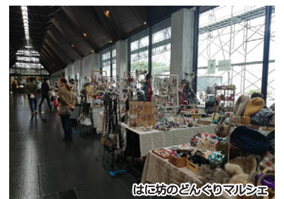
はに坊のどんぐりマルシェ