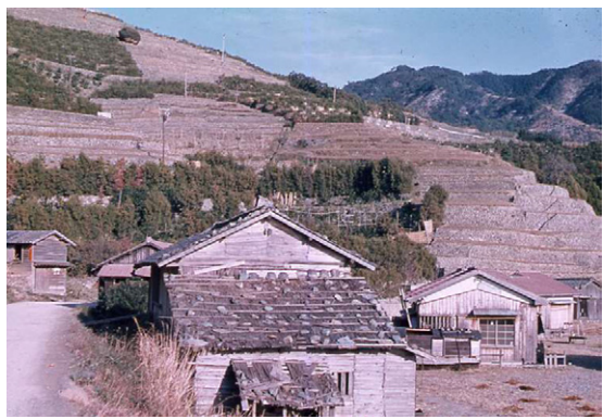
宇麦から柑橘に転換する段々畑(八幡浜市真網代、昭和34年)

愛媛県の宇和海沿岸部では、近世にイワシ漁が盛んになるとともに、リアス式海岸の急傾斜地を段畑として切り開き、芋・麦を中心とする農業が定着しました。近代に入ると、かまぼこ・じゃこ天の水産加工業、はまち・鯛・真珠の養殖業、柑橘栽培が産業として発展しました。本展では宇和海のくらしと景観に目を向け、そこで営まれる生業について、歴史資料や民俗資料で紹介します。展示を通じて、重要文化的景観「遊子水荷浦の段畑」、「宇和海狩浜の段畑と農漁村景観」、日本農業遺産「愛媛・南予の柑橘農業システム」にもなっている宇和海の魅力に迫ります。