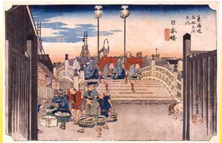
歌川広重《東海道五拾三次之内 日本橋》（保永堂版）

開館時間／午前9時～午後5時30分（入館は閉館の30分前まで） 休館日／9月24日（木）、28日（月）、10月6日（火）、10月13日（火）、19日（月）、26日（月） 主催／愛媛県歴史文化博物館 後援／愛媛県市町教育委員会連合会・愛媛新聞社・NHK松山放送局・南海放送・テレビ愛媛・あいテレビ・愛媛朝日テレビ・愛媛CATV・FM愛媛 観覧料／大人（高校生以上）500円（400円） 小中学生・65歳以上250円（200円） *（ ）内は20名以上の団体料金 *他にお得な常設・特別展共通券もあります。