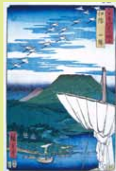
歌川広重 六十余州名所図会 伊豫西條

当館で収蔵する、絵巻物・浮世絵・画帳・観光用鳥瞰図といった絵画資料の中から、瀬戸内海の航路や伊予の名所・風物などを描いた資料約 50 点を集めて展示します。また、この機会に中世成立の絵巻物の模本なども合わせて紹介します。