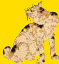
歌川芳藤《子猫あつまって大猫となる》（部分）