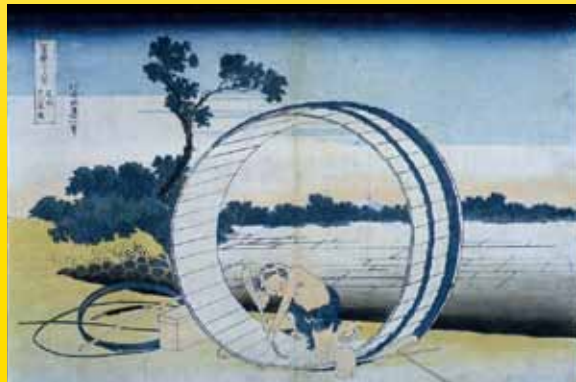
葛飾北斎《富嶽三十六景 尾州不二見原》

本展では歌川広重の「東海道五拾三次」（保永堂版）、「五十三次名所図会」（縦絵東海道）と葛飾北斎の「東海道五十三次」（小判）を、大正時代の現地の写真も添えて一堂に展示します。日本橋から京都までの東海道をめぐる夢の競演をお楽しみください。その他にも、喜多川歌麿とその流れをくむ絵師たちの美人画、東洲斎写楽の役者絵、北斎の「富嶽三十六景」など、浮世絵の黄金時代ともいえる18世紀後半の名品をはじめ、幕末の開港地横浜の風俗を描いた「横浜絵」、伝奇小説や怪談をテーマにした「妖怪絵」、ジグソーパズルのようなユーモアあふれる「寄せ絵」など、バラエティに富む浮世絵227点を紹介します。旅情、人間模様、洒落とユーモアの遊び心など、江戸時代の生き生きとした情緒あふれる浮世絵の世界を、この機会にぜひご堪能ください。