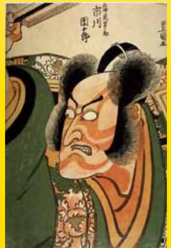
歌川豊国《三浦荒男之助 市川團十郎》