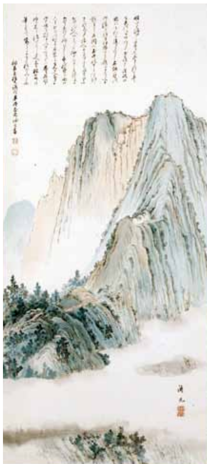
(専門学芸員 井上淳)

本資料には多くの信者が神像を支持する姿が描かれていますが、石鎚神社の祠官となった梧菴はそこに石鎚山の理想的な姿を見出していたのかもしれませんが。