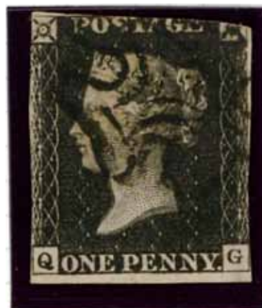
年代 1840年 所蔵 当館蔵 サイズ 縦2.4cm×横2.0cm

引目鉤鼻の気品に満ちた表情と、団子のような丸顔が特徴の雛人形。江戸時代、京都の雛人形師・雛屋次郎左衛門によって創案されたといわれるところから、次郎左衛門雛の名で呼ばれています。まるで源氏物語絵巻の登場人物が抜け出したかのような容貌からか、大名家や公家などの上流階級で長く愛好され、一般的な流行に関わりなく作り続けられました。確認されている次郎左衛門雛の多くは黒い袍と袴をつけた束帯姿の男雛、五衣に華やかな唐衣、裳をまとい、緋袴をつけた姿の女雛