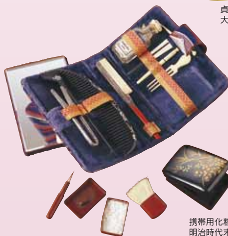
携帯化粧道具セット 明治時代末期～大正時代