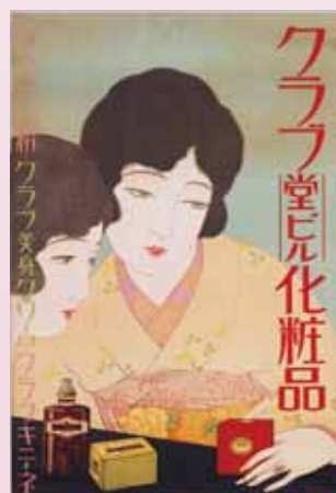
クラブ化粧品ポスター「クラブ堂ビル化粧品」 大正時代