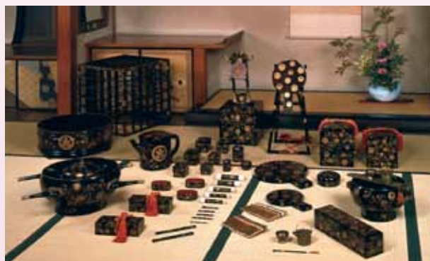
橘唐草紋散蒔絵婚礼化粧道具 江戸時代後期

本展覧会ではポーラ・コレクションより、近世から近代にかけての化粧道具をはじめ、髪型、衣装、装身具、絵画資料など、広く化粧文化に関わる資料を展示します。「美しくありたい」という女性の願いは変わりませんが、時代とともに美意識は移り変わり、化粧やよそおいにも反映されていきます。それぞれの時代の美を追求する女性たちの姿を多彩な資料からご覧ください。