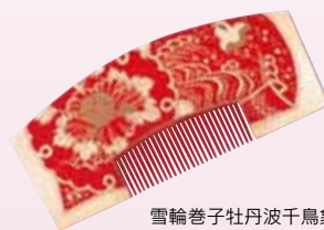
雪輪巻子牡丹波千鳥象牙櫛 江戸時代後期