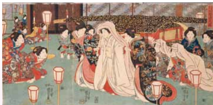
三定例之内 婚礼之図 嘉永元(1848)年

開館時間/午前9時～午後5時30分(入館は閉館の30分前まで) 休館日/2月22日[月]、3月2日[火]、3月8日[月]、3月15日[月]、3月23日[火]