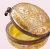
貞明皇后御所用化粧容器 大正時代