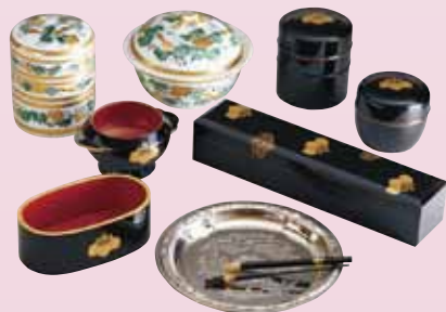
五三桐紋蒔絵婚礼化粧道具より化粧小物 明治時代後期