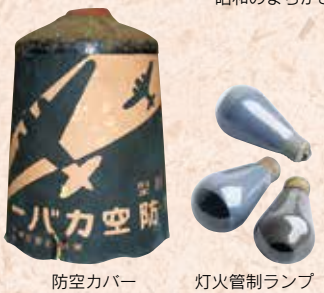
防空カバー 灯火管制ランプ