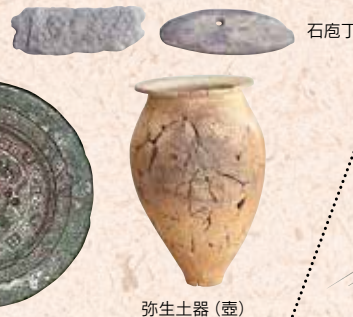
相の谷1号墳出土 獣紋鏡 弥生土器(壺)

瀬戸内海の形成と愛媛県最古の人々・縄文時代の人々の生活・弥生時代の人々の生活・大和朝廷と伊予・伊予の律令体制・古代信仰の広がり・瀬戸内海舟運と藤原純友の乱