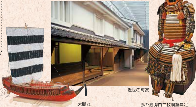
大鵬丸 近世の町家 赤糸威胸白二枚胴具足

太平に向かう伊予・伊予八藩・幕藩体制下の人々の生活・近世の交通・伊予の学問・幕末の伊予