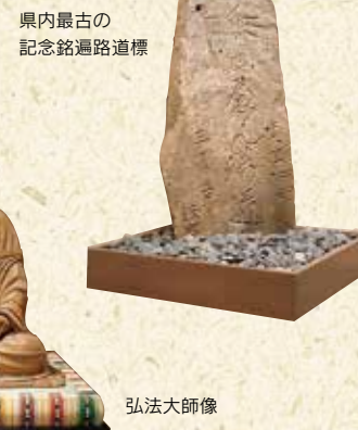
県内最古の 記念銘遍路道標