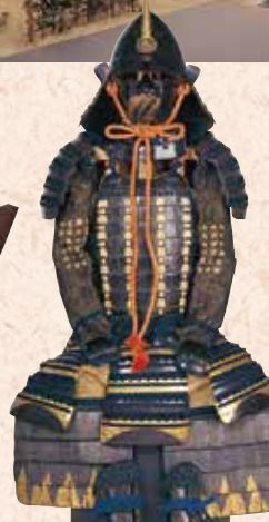
紺糸威二枚胴具足