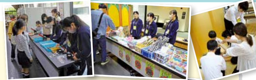
高校生ボランティアのみなさんが頑張ってくれました。

そして期間中、延べ70人以上の高校生ボランティアの方にお手伝いをしていただきました。そのおかげで4日間、全てのイベントを滞りなく運営することができました。この場をお借りして御礼申し上げます。また、歴博では通年で活動して下さるボランティアの方も常時募集しております。ご興味のある方はお気軽にご連絡ください。